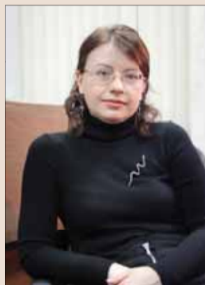
Анна ЗАКАТНОВА, «Российская газета», специально для «Права каждого»

Пиратов и похищенных принцесс в этой истории нет. Все остальное – потерянная мнимая дочь, тайны с завещанием, коварный обман и ужас жертвы – в избытке. Нет, это не авантюрный роман, это наша жизнь в определении Верховного Суда РФ № 5-КГ 12-4. И жертв в этой истории даже две, одна из них – нотариус.